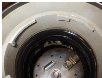
【図2：塗装剥がれ状況】